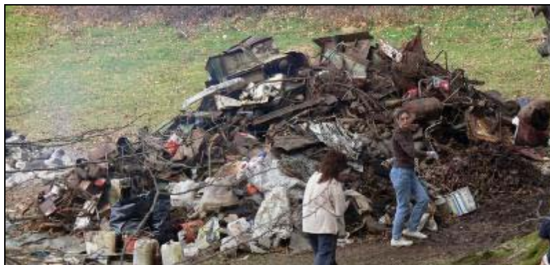
Ci-dessus : tas de déchets évacués lors de la dépollution du gouffre du Camion (mars 2006)

Nous nous efforçons d'accompagner ces opérations par des actions parallèles d'information et de sensibilisation sur les conséquences des rejets directs des déchets dans la nature : intervention dans des écoles, soirées de sensibilisation, médiatisation de l'action, mise en place d'aménagements sur les sites (panneau d'information, ...).